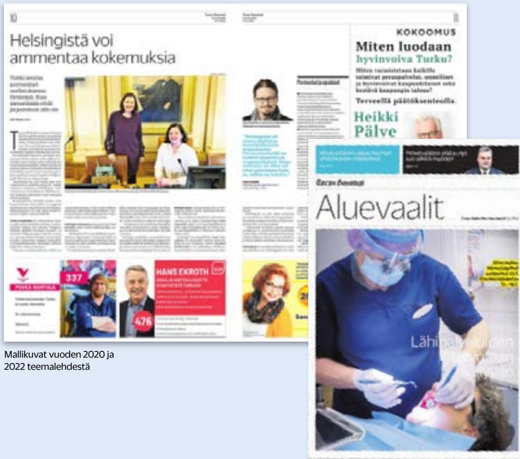
Mallikuvat vuoden 2020 ja 2022 teemalehdestä